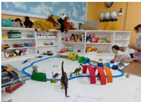
リラのいえ きょうだい児保育 保育士 大石 貴子

この保育を続けていくには、保育士が足りません。多くの方に知って頂き関わってくださる方、保育士一同心よりお待ちしております。